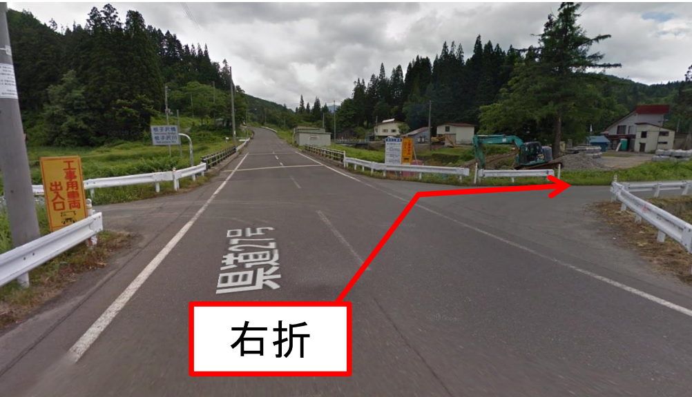
写真③ 根子沢橋の手前で右折