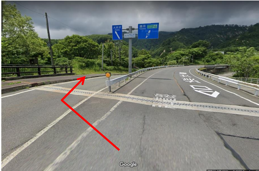
写真① 112号分岐を大井沢方面に進む