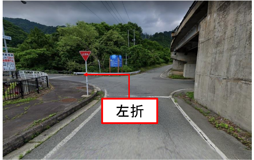
写真② 左折し、しばらく道なりに進む